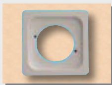
MARCO 1 ELEMENTOS (86,5 x 86.5)